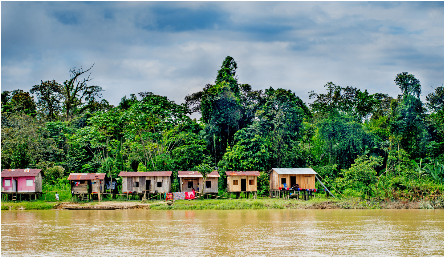
Foto: Casas sobre el río Atrato, Colombia