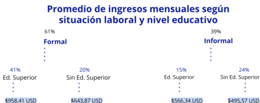
Diagrama realizado a partir de encuesta Casen 2022

Además, se identifica que la formalidad del empleo incide en el ingreso promedio mensual de la población migrante venezolana, según la data registrada en la encuesta Casen 2022. A continuación, se presenta la siguiente información 19 :